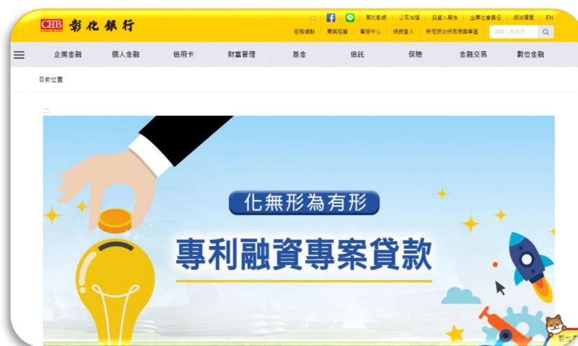
圖3、彰化銀行 專利融資專案貸款

在 109 年銀行界也親自出席匯聚全國最重要科技成果的「台灣創新技術博覽會」，實際體現科技市場與資本市場的鏈結，希望能帶動金融機構將融資標的從有形資產走向無形資產，協助創造更多成功案例。