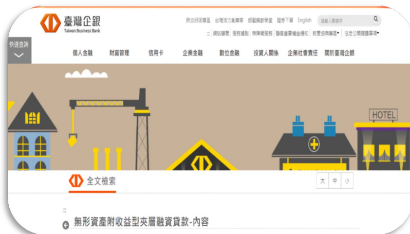
圖2、臺灣企銀 無形資產附收益型夾層融資貸款