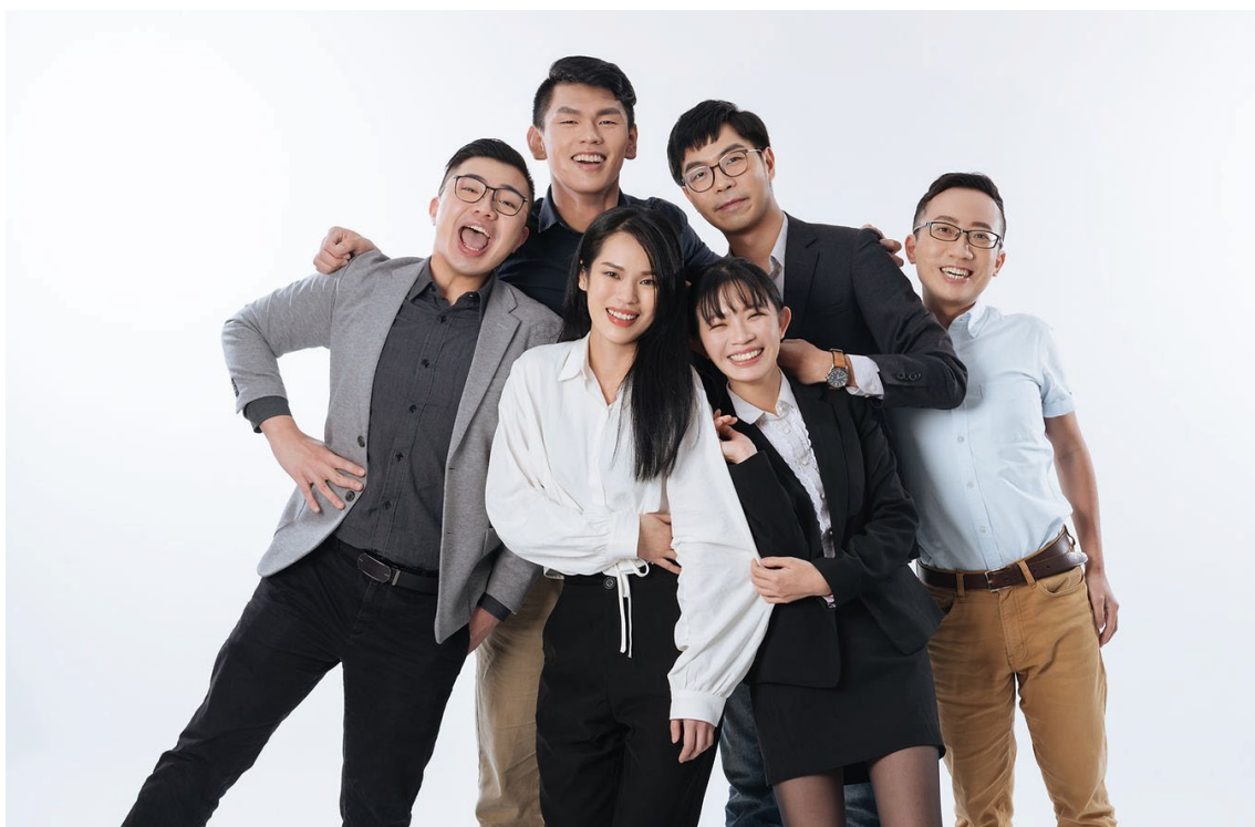
圖 1、醫盟科技團隊