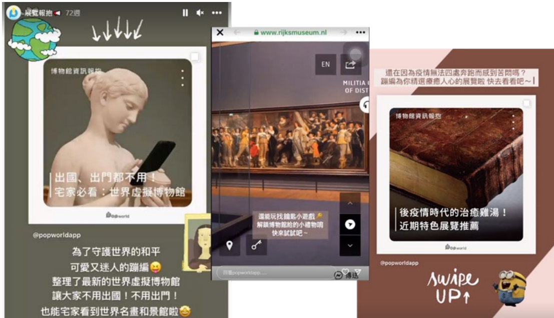
圖 3、非接觸式虛擬博物館可以隨時隨地欣賞藝術

如今，蹦世界已與數百個觀光景點合作、上百款實境解謎遊戲，成為全台最大的智慧導覽與實境解謎遊戲平台，亦獲選為國內智慧觀光產業鏈實境導覽廠商代表。在母校牽線下開始與海外新創事業合作線上/線下服務。展望2023年，顧客客製化訂單已經超過今年訂單數6成，歐洲、美國及東南亞市場需求也隨著國門解封而更加熱絡。為有效推展國際化發展，蹦世界新媒材皆有日文版及英文版同步發聲，讓「蹦世界」正如其名，躍入美國、歐洲及東南亞，而非僅僅只是「蹦台灣」。