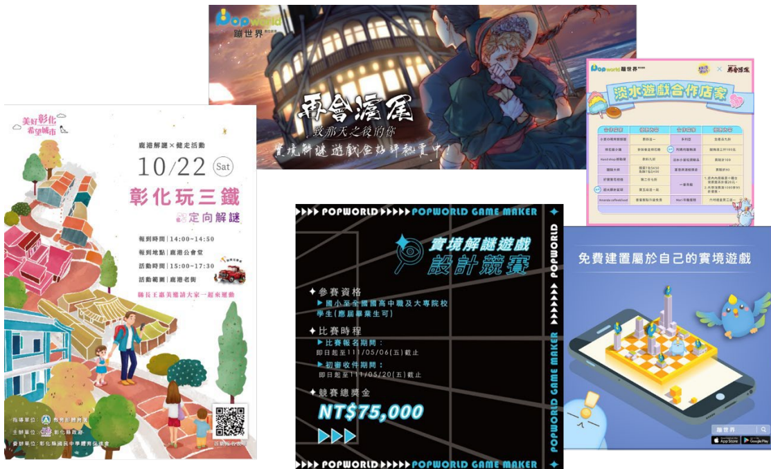
圖 2、智慧導覽與實境解謎遊戲平台

專利融資及媒體廣宣，為初創階段的蹦世界提供孵育搖籃。至今短短兩年，蹦世界的實境解謎平台已經高達十多萬人下載，公司在智慧導覽/實境解謎遊戲項目的營收已增加超過五成，員工人數也陸續擴增。除了早期的新北市鶯歌陶瓷博物館、十三行博物館外，淡水古蹟博物館、黃金博物館都已導入了蹦世界多國語言導覽服務。值得注意的是，當大部分產業受疫情衝擊而縮減訂單時，蹦世界仍然透過 O2O 線上/線下雙重服務模式獲利亮眼。未來增資計畫尋找大型創投或是私募基金，持續研發平台技術、豐富遊戲內容，整合策略夥伴積極開拓歐美及亞洲智慧導覽與遊戲市場，這也讓創業之初積極融資的台企銀，對於蹦世界的經營實力充滿期待。